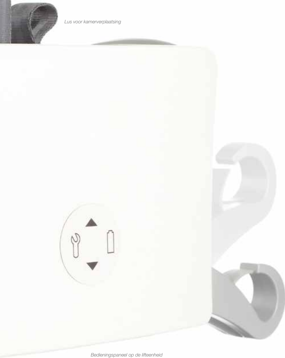
Bedieningspaneel op de lifteenheid